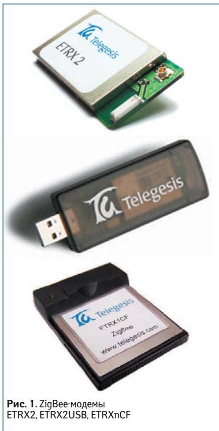
Рис. 1. ZigBee-модемы ETRX2, ETRX2USB, ETRXnCF

Встроенная функциональность модемов ETRX2 является еще одним их преимуществом, так как позволяет использовать их без внешнего микроконтроллера, что значительно облегчает работу с ними.